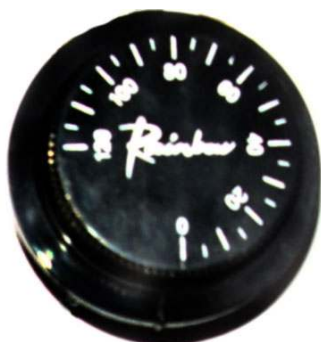
Рис. 1 Регулятор температуры.